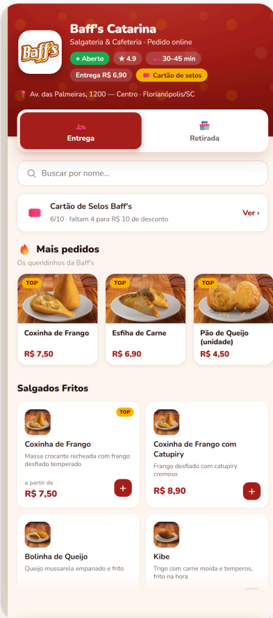
Web — cardápio (listagem por grupo)

O mesmo pedido funciona pelo navegador (link e QR Code) e como aplicativo instalável. Abaixo, telas reais do protótipo.