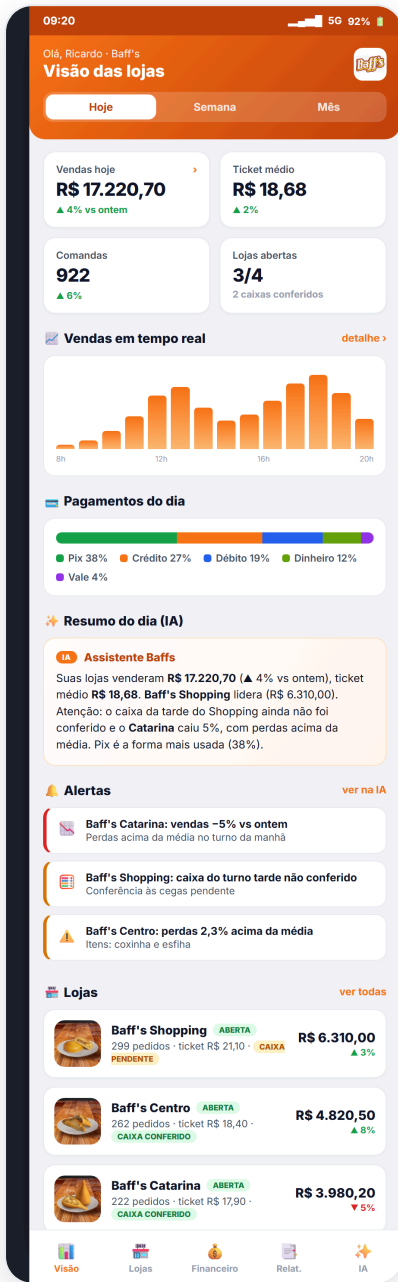
Visão das lojas (tempo real)

O gestor abre o app e vê todas as lojas na palma da mão. Abaixo, telas reais do protótipo.