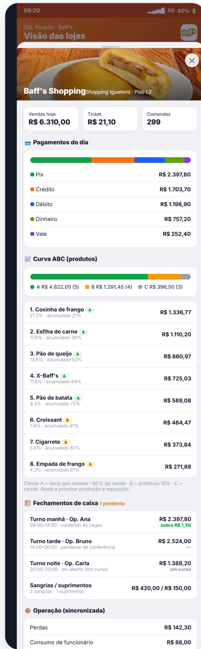
Loja: caixa por turno, contas e vitrines